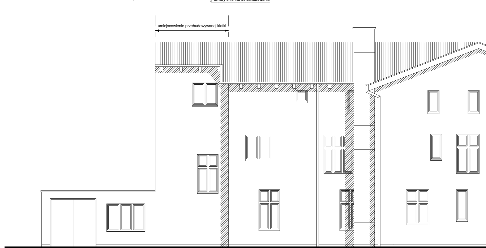
ELEWACJA WSCHODNIA - STAN PROJEKTOWANY