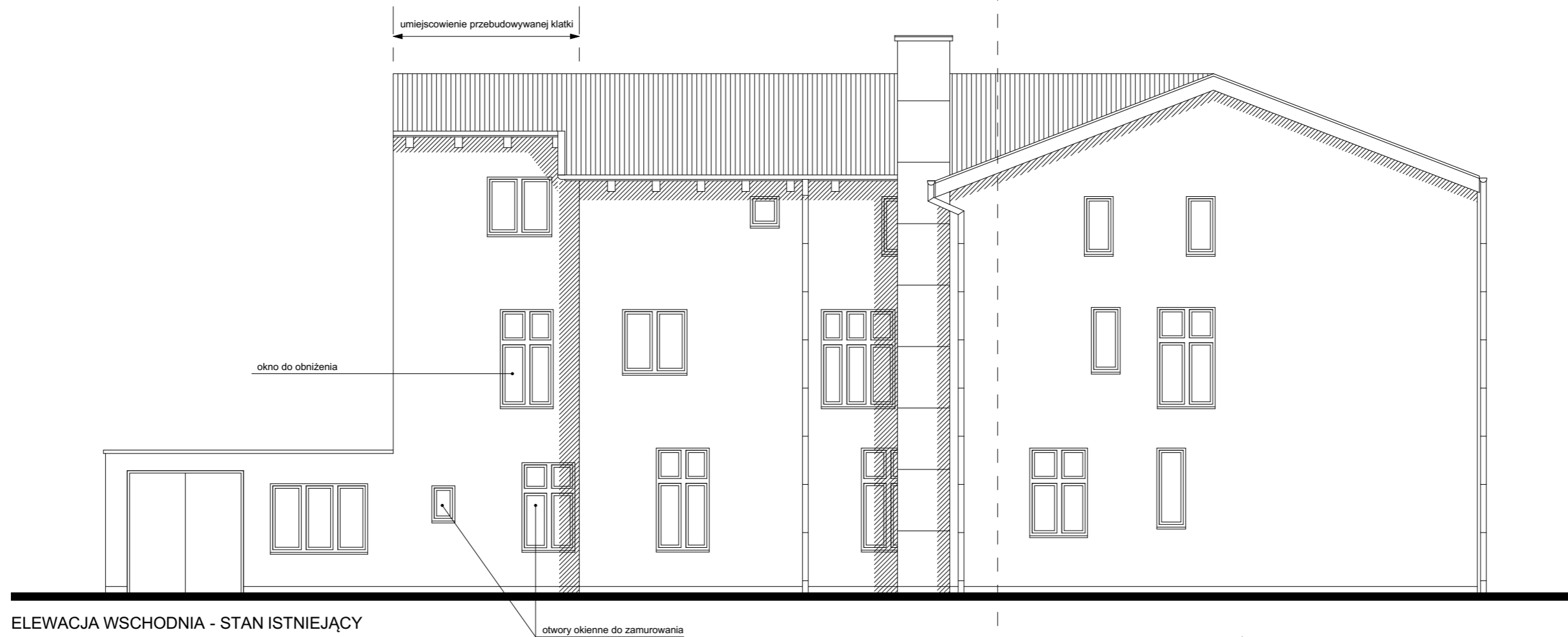
ELEWACJA WSCHODNIA - STAN ISTNIEJĄCY